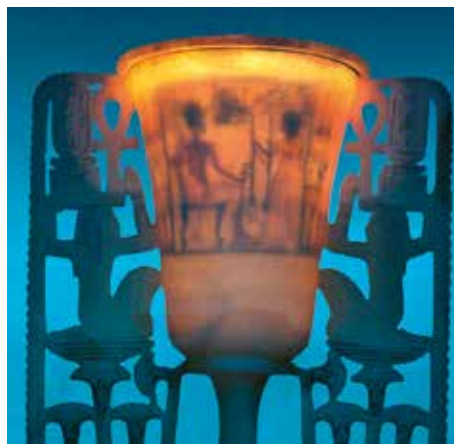
Abb. 9 Die Alabasterlampe in Form einer Lotosblüte mit einer durchbrochenen Dekoration zu beiden Seiten ist mit einer Bemalung der Innenschale versehen, die erst im Durchlicht erkennbar wird: Der König sitzt in legerer Haltung auf einem Thron oder Stuhl, seine Gemahlin Anchesenamun präsentiert ihm zwei Palmwedel. – (Foto akg-images / Werner Forman).

Als eine Art Vorläufer für die Hinterglasmalerei von Gefäßen ist eine kerngeformte Flasche(?) in Form eines Fisches zu betrachten 39 (Abb. 10). Sie besteht aus transparentem, nahezu farblosem Glas und weist an der Innenseite eine »Bemalung« auf: Augen, Schuppen und Flossen sind in den Farben Blau und Gelb rück- bzw. innenseitig aufgebracht. Dafür wurde vermutlich auf einen der Innenform des Gefäßes entsprechenden Kern eine Art Emailfarbe aufgetragen und während der Anfertigung des Gefäßes verschmolz die Farbe mit dessen Innenseite. Hinweise auf diesen Fertigungsprozess scheinen die noch anhaftenden Reste des Kernmaterials zu geben, die sowohl an den innen liegenden Oberflächen der Farbschichten als auch des transparenten Glases erhalten sind 40 . Im gleichen Verfahren, man könnte es eigentlich auch als eine Art Überfangtechnik bezeichnen, wurde wohl zudem ein Amphoriskos aus dem Grab des Amenophis II. hergestellt und – ein hohes Maß an handwerklichem Können