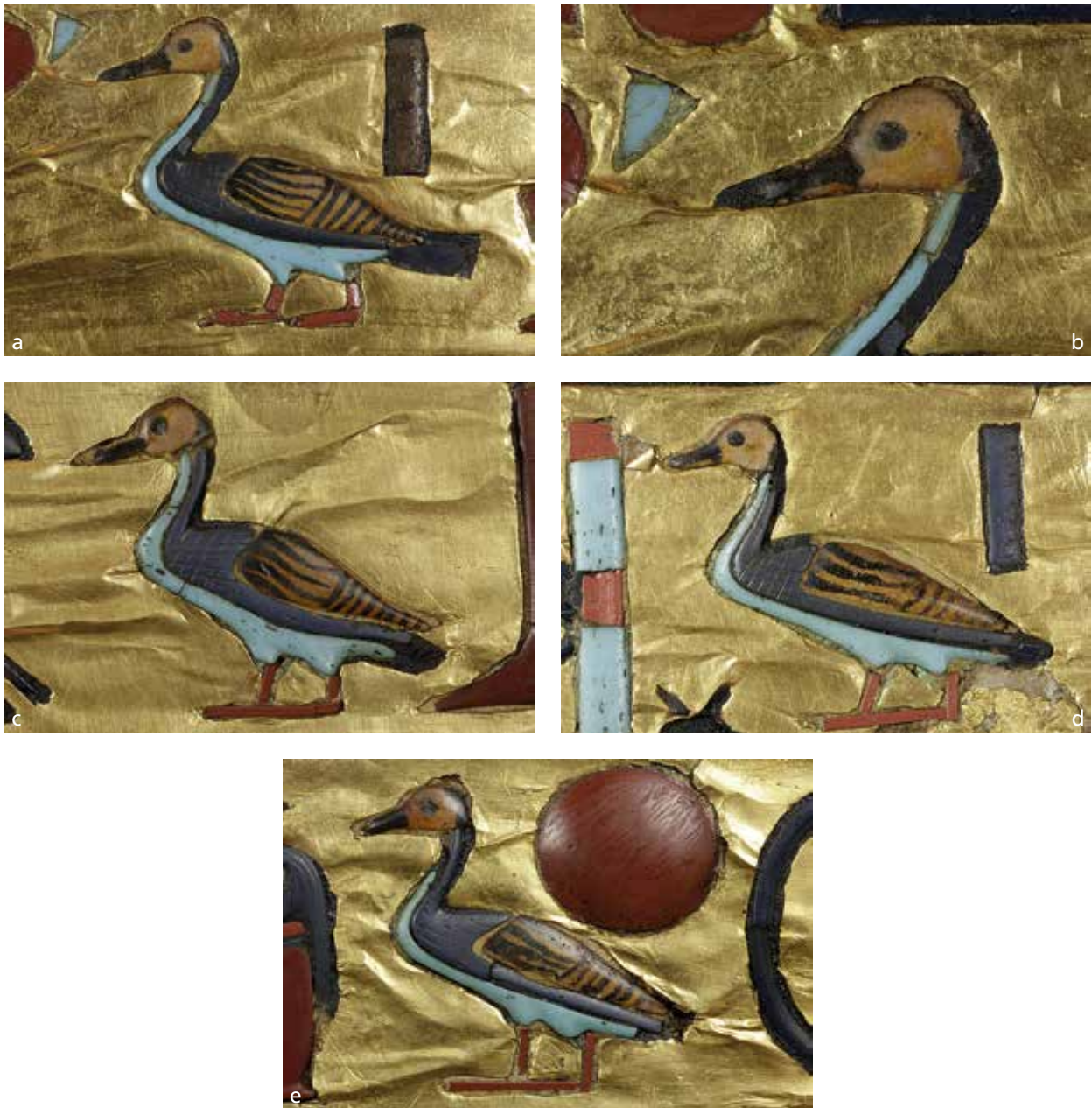
Abb. 20 Das gb -Zeichen in der Inschrift auf der rechten Seite der Sargwanne (a). Zu den vorgeformten, vermutlich durch Schmelzen in einer offenen Form gefertigten hell- und dunkelblauen sowie den transparenten farblosen hintermalten Einlagen wurden kleinere Partien wie die Füße oder die abgebrochenen Stellen am Hals durch Segmente von im Profil querrechteckigen Glasstäbchen ergänzt. Die obere Einlage zur farbigen Gestaltung der Schwanzfedern besteht aus einem im Querschnitt runden Stäbchen von weniger als 1 mm Durchmesser! Die Detailaufnahme des Köpfchens (b) verdeutlicht, dass nicht nur die rückseitige Bemalung am Hinterkopf die Linienführung der dunkelblauen Einlage aufgreift und fortsetzt, sondern in diesem Bereich auch die Einbettmasse farblich angepasst wurde. An einem weiteren gb -Zeichen (c) sind die Schwanzfedern verkürzt, eine einst vermutlich vorhandene Einlage ist verloren. Auch scheint die Schnabelpartie leicht missglückt, das ganze Köpfchen erinnert eher an einen Storch. Par excellence stellt sich die farbliche Anpassung des Einbettmaterials an einem s3 -Zeichen dar (d) – ein blauschwarzer Ton umfängt die dunkelblaue, ein hellgrüner die türkisfarbene Einlage, ein gelblich-beiger Farbton die hintermalte Schwinge und eine rötlich pigmentierte Masse die Beine/Füße. Bei dem letzten Beispiel aus der seitlichen Inschrift (e), die Schriftzeichen sind hier in der Reihenfolge ihrer Position im Text aufgeführt, ist die durch Schleifen angebrachte Binnendekoration – mehrere sich kreuzende Linien – der dunkelblauen Einlage weniger stark ausgeprägt als auf den anderen Exemplaren. Egyptian Museum Cairo (EMC), JE 60671. Demnächst im Grand Egyptian Museum, Giza.