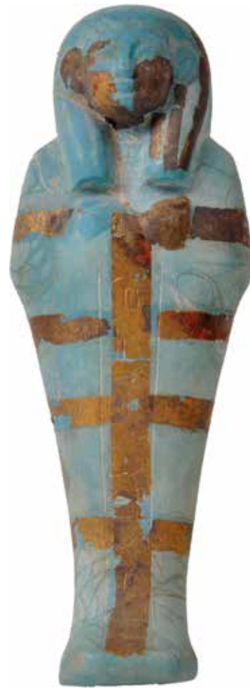
Abb. 5 Ein Uschebti des Hekareshu: Dünne Goldfolien zieren Hände, Ohren und Gesicht, die Haartracht, die Inschrift auf der Mittelsäule sowie die quer verlaufenden Mumienbänder, und bewirken so ein charmantes Farbspiel mit dem türkisfarbenen Glas. Egyptian Museum Cairo (EMC), JE 34405; 17,5 cm (H.).

Zwei Gefäße gelten als Exoten unter den polychrom verzierten Objekten: zum einen ein lotosförmiger