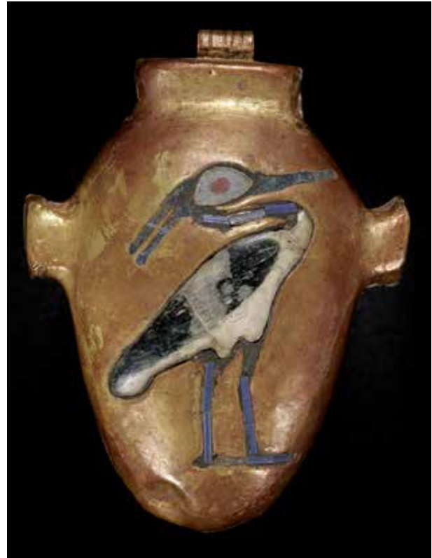
Abb. 26 Einlagen aus blauem Glas dekorieren die Beine, den Hals und vermutlich einst auch den Schnabel sowie die Schmuckfedern des Reihervogels. Ein farblos-transparentes Glas bildet die Einlagen für Kopf und Körper, letzterer ist zweifarbig in den Farben Weiß (s. Anm. 32) und (einst) Blau bemalt. Egyptian Museum Cairo (EMC), JE 61866. Demnächst im Grand Egyptian Museum, Giza.

durch entsprechend geformte Einlagen bzw. motivbildende, kleine goldene Stege (Zellwände) hinzuzufügen 84 (Abb. 26).