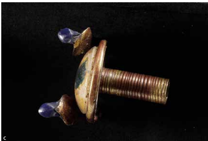
Abb. 28 a Flankiert von zwei Uräen schmückt die Einlage mit dem hintermalten Königsporträt das Endstück des vorderen Tubus. Einzig der schwarze Farbton von Brauen, Pupille und den Lid- bzw. Schminkstrichen ist in gut erkennbarer Qualität erhalten. – b UV-Licht verstärkt die ursprüngliche Bemalung der Einlage: Insbesondere feine Details wie die Uräusschlange an der Stirn des Königs, die Halsfalten oder die beiden im Nacken des Königs herabfallenden Bänder, die das Schläfenband fixieren, sind dadurch sehr viel besser erkennbar, ebenso die ursprünglich dunkelblaue Farbe der Krone. – c Detail der Einlage von oben. – (Fotos Ch. Eckmann, RGZM).