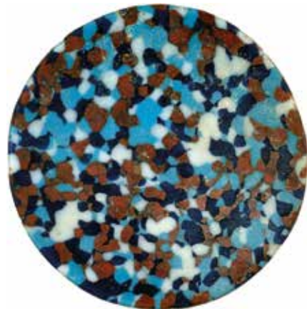
Abb. 3 Das kleine kreisrunde Tellerchen setzt sich – vermutlich in Anlehnung an Roten Granit – aus den Farben Weiß, Hell- und Dunkelblau sowie Rot (alle opak) zusammen. Ca. 1390-1353 v. Chr. Brooklyn Museum, New York, Abbott Collection, Charles Edwin Wilbour Fund, 48.162; 10,5 cm (Durchmesser). –.

Beachtenswert ist auch das frühe Auftauchen von Mosaikglas, beispielsweise in Form eines Gefäßes