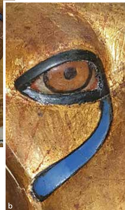
Abb. 14 a Einer der beiden Löwenköpfe an den Pfosten einer rituellen Liege Tutanchamuns. Die Tränenstreifen und die Nase sind durch vorgeformte opak-blaue Glaseinlagen dargestellt. – b Das rechte Auge im Detail. Jetzt im Grand Egyptian Museum, Giza.

Dargestellten in Form eines Federkleides. Neu ist, dass das (gemalte) Dargestellte – anders als bei den Augeneinlagen – im Original eigentlich nicht (z. T.) transluzent oder transparent ist, die Bemalung »nur« die Dekoration und detailreiche Ausarbeitung eines Vogelmotivs (überwiegend des Gefieders) wiedergibt. Eine figürliche Darstellung ist sie im eigentlichen Sinne natürlich noch nicht ( Abb. 16a-b ). Es ist offensichtlich, dass man mit der gewünschten Darstellung der Vielfarbigkeit des Falken aufgrund der geringen Größe des Motivs mittels Zellenein-