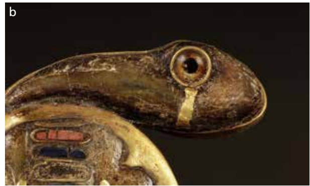
Abb. 13 a Die kleine Augeneinlage aus Glas an der Uräusschlange der Totenmaske Tutanchamuns. Die Pupille wurde rückseitig mit schwarzer Farbe aufgemalt. Egyptian Museum Cairo (EMC), JE 60672. – b Die Augeneinlage der Uräusschlange, die sich am rechten Seitenband des Diadems des jugendlichen Königs schlängelt, wurde zusätzlich rückseitig mit einer kleinen Aushöhlung versehen, in die schwarze Farbe eingebracht wurde. Egyptian Museum Cairo (EMC), JE 60684.

Exemplarisch für eine etwas schlichtere Variante, einen zur Darstellung einer Pupille rückseitig gemalten schwarzen Punkt, seien die kleinen, vermutlich plan-konvexen oder kugelsegmentförmigen Einlagen genannt, die das Köpfchen der Uräusschlange an der goldenen Totenmaske Tutanchamuns zieren 50 ( Abb. 13a ). Dabei ist nicht eindeutig erkennbar, ob die schwarze Farbe in eine zuvor gearbeitete rückseitige Vertiefung oder lediglich auf die Rückseite ein- bzw. aufgebracht wurde 51 . An einer Augeneinlage der Uräusschlange des prachtvollen Diadems des Königs ist dies jedoch offensichtlich: Eine kleine mit Farbpigmenten oder Harz (rückseitig) gefüllte Aushöhlung der Einlage verstärkt die dreidimensionale Tiefe des Auges und demonstriert zugleich eindrucksvoll, dass auch hier nicht der Hintergrund, sondern die Rückseite der Einlage bemalt wurde ( Abb. 13b ).