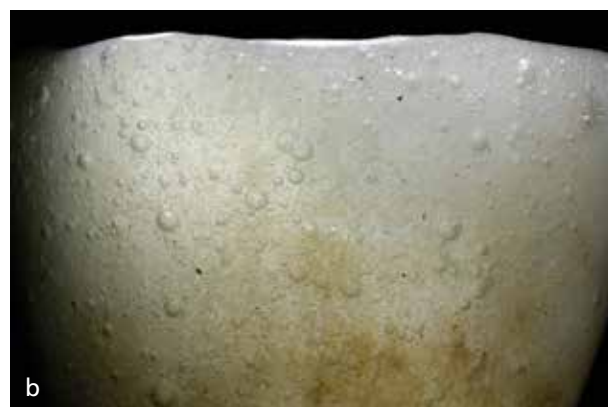
Abb. 8 a »Weißes« Glasväschen, ca. 5,2cm hoch. Es wurde wie sein dunkelblaues Pendant vermutlich über einem identischen Kern geformt. – b Im Durchlicht zeigt sich die »schaumige« Konsistenz/Struktur des verarbeiteten Glases, das tatsächlich nahezu farblos ist. Jetzt im Grand Egyptian Museum, Giza.