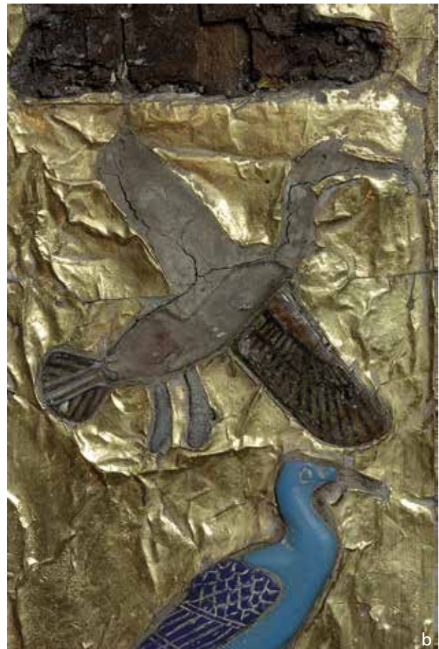
Abb. 22 Das Federkleid der weit geöffneten Schwingen wurde präzise gezeichnet (a), ebenso sind – wenn auch weniger gut erhalten – an Kopf, Hals und Körper des Vogels Hintermalungen erkennbar (vgl. auch Abb. 23d). In die Einlage für die Schwanzfedern (b) wurde, neben den rückseitig aufgemalten Streifen, durch Schleifen eine zusätzliche Binnendekoration in die Oberfläche gearbeitet. Bei aller gebotenen Vorsicht kann man sich in der Betrachtung der Bilder nicht des Eindrucks erwehren, sämtliche Einlagen seien aus farblosem transparentem Glas gearbeitet. Zumindest für die Einlage des Körpers können wir es aber aufgrund der zahlreichen typischen Bläschen mit Sicherheit annehmen. Egyptian Museum Cairo (EMC), JE 39627(a).2. – (Fotos Ch. Eckmann, RGZM / E. Mertah, EMC).

und darüber hinaus die präzise Bestimmung der dafür verwendeten Trägermaterialien ermöglicht.