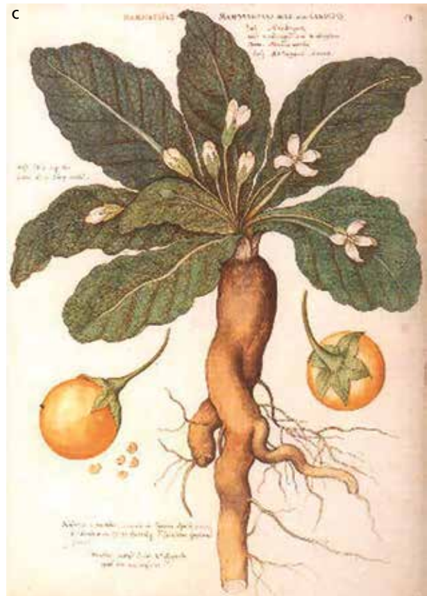
Abb. 17 a Zur Darstellung eines Skarabäus wurden jeweils mehrere Segmente Lapislazuli zur Fertigung größerer Teilstücke patchworkartig passgenau aneinandergesetzt, deren plastische Form sowie die Binnenzeichnung der Flügel anschließend durch Schleifen erzeugt wurden. – b An beiden Seiten der Armspange ist der Skarabäus mit jeweils einem Pflanzenmotiv dekoriert: Zwei Mohnblüten flankieren eine Beere (Alraune), zwischen den Stielen sind kleine Goldblechornamente in Form von Margeriten erkennbar. Die transparente Glaseinlage zur Darstellung der Alraune ist grün (Kelchblätter) und gelb/orange-rot (Frucht) hintermalt. Bemerkenswert ist auch das winzige weiß-blau gesprenkelte Glas, das den Raum zwischen den Pflanzen füllt. Egyptian Museum Cairo (EMC), JE 62360. – c Im Vergleich mit einer Zeichnung der Alraune wird die realitätsnahe Darstellung verdeutlicht, einzig die leicht spitze Form der Frucht ist geringfügig abweichend, was je nach Art aber nicht ungewöhnlich ist. – (a-b Fotos Ch. Eckmann, RGZM; c Bild/Zeichnung Museum für Verhütung und Schwangerschaftsabbruch, Wien).

lage-Technik oder eines mosaikartigen Zusammensetzens kleinerer Teile in eine Zelle oder Grube mit Sicherheit an deren technologisch durchführbare Grenzen gestoßen wäre und es daher wohl vorzog, diese Illustration aus praktischen Erwägungen lieber rückseitig auf einige wenige Einlagen zu malen. Die bisher vorgestellten Hintermalungen von (Quarz-/Bergkristall-) Einlagen dienen also zum einen der Imitation von transluzenten Edelsteinen, wie z. B. dem Karneol, zum anderen aber auch der möglichst plastischen Darstellung und farbigen Illustration/Ausarbeitung von Augen oder Körpermerkmalen und -charakteristika (Gefieder), immer jedoch dem gestalterischen Spiel mit Farbe und dem trans-