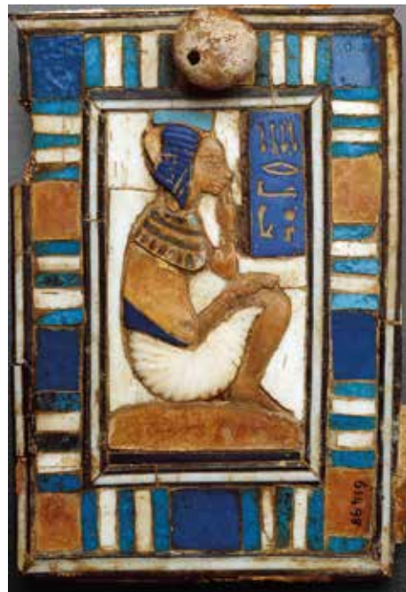
Abb. 18 Im Unterschied zur Darstellung des Falken in Zelleinlage-Technik (s. S. 72-75, Abb. 15 und 16a-b) ist diese kleine Einlage Teil einer mosaikartig zusammengesetzten Darstellung auf dem Deckel einer kleinen Kiste. Sie zeigt ein Kind in hockender Pose, die rechte Hand zu den Lippen geführt, die linke ruht auf den Knien. Eine Einlage ist rückseitig bemalt und stellt ein Wesech/Usech, einen Halskragen, mit einer Reihe (tropfenförmiger?) Anhänger dar. Der Deckel selbst ist ca. 10 cm × 7 cm, die kleine Einlage demnach ca. 1,4 cm groß. Jetzt im Grand Egyptian Museum, Giza.

Werfen wir einen Blick auf den ca. 10 cm × 7 cm großen Deckel einer kleinen (Kosmetik-?) Schatulle 67 , springt einem sofort die markante Ähnlichkeit einer Einlage mit den oben vorgestellten Exemplaren der Falkendarstellung ins Auge 68 (Abb. 18): Die Einlage dient der Darstellung eines Wesech/Usech, eines Brustschmucks am Hals einer Amarna-Prinzessin, möglicherweise Neferneferure 69 , und ist in Bezug auf den Malstil, auf den ersten Blick auch auf die Farbgebung, durchaus vergleichbar mit den Einlagen der Falkendarstellung. Allerdings wurde der gesamte mehrteilige Halskragen mittels einer einzi-