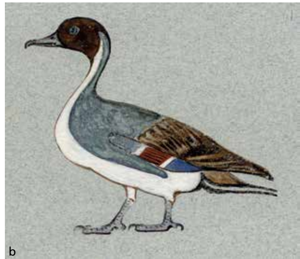
Abb. 21 Wie am Sarg Tutanchamuns auch, wurde der Körper des Vogels aus individuell vorgefertigten, überwiegend hell- und dunkelblauen, opaken Glaseinlagen zusammengesetzt ( a ). Einzig für den Kopf und einen Teil der Schwinge wurden transluzente/transparente Einlagen rückseitig bemalt. Bemerkenswert detailverliebt sind auch eine winzige weiße und eine schwarze Einlage im Gefieder, eine dritte scheint verloren. Man hat den Eindruck, als würde man von einem kleinen Auge »beobachtet«, jedoch handelt es sich dabei wahrscheinlich um eine Zeichnung des Gefieders. Auf einem Aquarell mit der Darstellung einer Spießente ( b ) – der Künstler ist H. Carter selbst – ist unter den Federn der Schwinge eine kleine dreifarbige Zeichnung des Gefieders erkennbar, ganz ähnlich den winzigen Einlagen des s3-Zeichens am Sarg des Juja. Egyptian Museum Cairo (EMC), JE 68962.2. – (Foto Ch. Eckmann, RGZM / E. Mertah, EMC; Aquarell H. Carter [Carter_vii_1_07_1 m], © Griffith Institute, University of Oxford).

Quarz/Bergkristall oder einem anderen transluzenten/transparenten Stein bzw. Mineral gearbeitet 76 ( Abb. 21a-b 77 ).