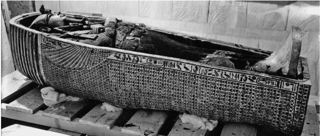
Abb. 19 Die Sargwanne des mittleren Sarges von Tutanchamun, in deren seitlichen Inschrift sich die Schriftzeichen mit den hintermalten Einlagen befinden. Sie wurde in der Grabkammer vorerst auf einen hölzernen Lattenrost über dem Sarkophag aufgebockt, im Inneren liegt in situ noch der massiv-goldene Sarg, der die Mumie des Königs umhüllt.

Vier Hieroglyphen (je 2 × gb und s3 ) 71 sind Bestandteil der seitlich (rechts) die Sargwanne umlaufenden Inschrift, eine weitere ( gb ) befindet sich in der Inschrift auf der Mittelsäule des Deckels 72 . Wie alle weiteren Schriftzeichen auch, sind sie überwiegend mit farbigen Einlagen aus opakem Glas dekoriert. Die Vogelkörper setzten sich aus jeweils einer opaktürkisfarbenen und einer opak-dunkelblauen, darüber hinaus aber auch aus einer transparenten hintermalten Glaseinlage zusammen – alle wahrscheinlich durch Formschmelzen in einer offenen Form vorgefertigt. Letztere dient der Illustration der angelegten Flügel der Vögel: erneut durch eine schwärzliche Zeichnung, die wahrscheinlich vereinfacht die Unterscheidung von Flügeldecken und Arm- bzw. Hand-schwingen der Vögel kennzeichnen soll, ausgeführt und mit einem bernsteinfarbenen Hintergrund unterlegt. Eine stilistische Besonderheit weist die Bemalung der Einlagen für die Köpfchen auf: Die Einlagen wurden ebenfalls durch Schmelzen von transparentem, farblosem Glas in eine entsprechende Form gebracht, Schnabel und Auge mittels schwarzer Bemalung akzentuiert. Darüber hinaus findet sich am Hinterkopf eine heute schwärzliche, einst wahrscheinlich dunkelblau 73 Zeichnung des dunk-