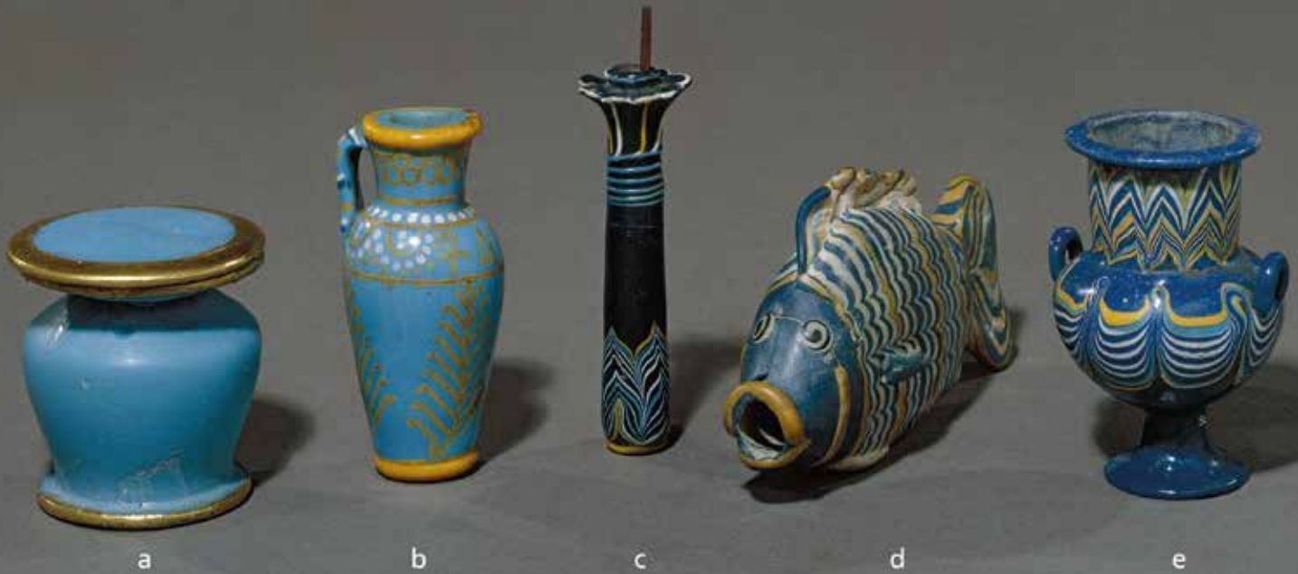
Abb. 1 a Das kleine Töpfchen zur Aufbewahrung von Schminkefarbe stammt aus dem Handel, wird aufgrund seiner ungewöhnlichen Form jedoch relativ sicher in die Regierungszeit des Thutmosis III. datiert. Zur Aufnahme der Farbe diente lediglich eine zylindrische Bohrung im Inneren des Gefäßkörpers. British Museum, London, EA 24391; 6,3 cm × 6,4 cm (H. × B.). – b Die kleine Kanne aus hellblauem Glas ist überwiegend mit einer Art Glasurmalerei (weiß und gelb) dekoriert, an der Schulter mit dem Namen des Thutmosis III. Einzig Hals- und Bodenrand sind mit Fadenauflagen aus gelbem Glas, der Henkel mit Fadeneinlagen aus weißem, gelbem und dunkelblauem Glas verziert. British Museum, London, EA 47620; 9 cm (H.). – c-e Beispiele kerngeformter, fadendekorierter Gefäße der 18. Dynastie: Ein kleines Kohlpalmsäulchen ( c ) ist im unteren Drittel mit einem Federmuster aus gelben, hellblauen und weißen Fadeneinlagen verziert, im oberen Drittel mit gleichfarbigen Fadenauflagen. Ein kleiner Stab aus Holz diente dabei dem Auftragen der Augen- und Lidstriche. Das kleine Gefäß in Fischform ( d ) aus einem blauen Grundglas mit einem Girlandendekor aus weißen und gelben Fadeneinlagen wurde in Tell el-Amarna gefunden. Zur Betonung von Maul und Flossen wurden zusätzliche Fäden aus gelbem und blauem Glas aufgelegt. Lediglich knapp 9 cm hoch ist der kleine Krateriskos ( e ) aus dunkelblauem Grundglas mit eingelegten und zu Zickzacklinien und Girlanden verzogenen gelben, weißen und hellblauen Fäden. – c British Museum, London, EA 2589; 10 cm (H. Palmsäulchen); d British Museum, London, EA 55193; 14 cm (L.); e British Museum, London, EA 4741; 8,7 cm (H.). – (Foto © The Trustees of the British Museum).

gende Beitrag behandelt vornehmlich Befunde aus dem Grabschatz des Tutanchamun.