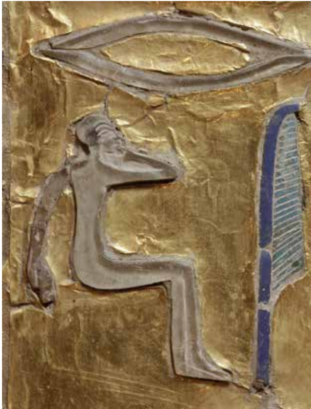
Abb. 25 Für die Schriftzeichen »Mund« (r3) oder »sitzendes Kind mit Hand am Mund« wurde ebenfalls farbloses transparentes Material für die Dekoration gewählt. Die Einlagen sind im Halbreief gefertigt, die Binnendekoration durch Schleifen ausgearbeitet. Erneut scheint es sich dabei um transparentes Glas zu handeln und vermutlich sind auch diese Einlagen einst (monochrom?) hintermalt worden, eine genaue Bestimmung steht jedoch noch aus.