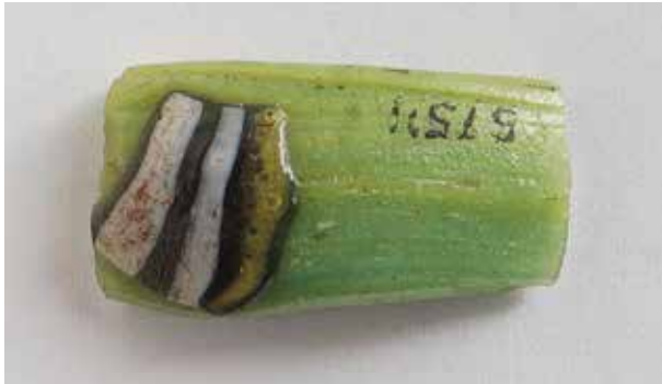
Abb. 4 Bei diesem Fragment eines Armrings aus hellgrünem Glas wurde eine vorgefertigte Applikation aus schwarzen, weißen und hellgelben Streifen lediglich auf die Oberfläche aufgeschmolzen, jedoch nicht – wie bei anderen Beispielen – durch Märbeln, das Wälzen auf einer Platte, plan in die Oberfläche eingearbeitet. Tell el-Amarna. British Museum, London, EA 57511; 2,32 cm (L.). – (Foto © The Trustees of the British Museum).

Vor allem aber kerngeformte, polychrome Glasgefäße ( Abb. 1c-e ) ergänzten das Repertoire aus Stein- und Quarzkeramik-Gefäßen zur Aufbewahrung seltener Parfüme oder wertvoller Öle; sie wurden in unterschiedlicher Intensität und Qualität bis weit in die griechisch-römische Zeit hergestellt 15 . In großer Zahl und mit einem breiten Formenrepertoire sind sie in den frühen Gräbern des Neuen Reiches belegt, später in den königlichen Wohnstätten in Tell el-Amarna und Malquata. Zu ihrer Herstellung wurde in der Frühphase vermutlich ein der Innenform des jeweiligen Gefäßes entsprechender Kern erhitzt und in zerriebenem Glas gewälzt, das sodann geschmolzen wird 16 . Nach mehrmaliger Wiederholung des Vorgangs war der Grundkörper des Gefäßes fertiggestellt; zur Dekoration konnten andersfarbige Glasfäden aufgelegt und mit einem spitzen Werkzeug zu Mustern ausgezogen werden. Das Dekor bzw. die Fäden wurden anschließend meist durch Märbeln glatt in die Oberfläche gearbeitet.