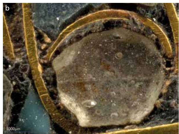
Abb. 11 a Eine offensichtlich durch H. Carter kopfüber (wieder-) eingesetzte Quarzeinlage am Halskragen der Totenmaske. Die eigentliche Rückseite – nun nach oben liegend – ist zusätzlich zur Färbung der Einbettmasse mit rotem Pigment hintermalt. – b Für die runden Einlagen in demselben Fries wurde in einigen wenigen Fällen auch transparentes Glas verwendet, allerdings befinden sich diese Beispiele noch in situ und ihre Rückseiten konnten nicht untersucht werden.

sondern rückseitig aufgetragen wurde, da dadurch sicherlich eine intensivere Farbwirkung oder Detaildarstellung erreicht werden konnte. Diese Überlegung untermauert bereits eine kleine Einlage im Halskragen der Totenmaske Tutanchamuns, die vermutlich im Zusammenhang mit der Restaurierung durch H. Carter 43 irrtümlicherweise mit der eigentlichen Rückseite nach oben eingesetzt wurde. Heute ist an der Oberfläche, also der einstigen Rückseite, eine rote Bemalung erkennbar, die – mit dem Ziel, bestmöglich Karneol zu imitieren – offensichtlich zu-