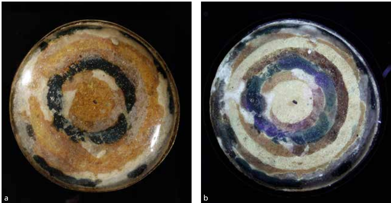
Abb. 29 a Detail des Endstücks am hinteren Tubus. – b UV-Licht verdeutlicht sechs, um den Kreis in der Mitte liegende, konzentrische Ringe sowie die Verwendung mehrerer Farben. – (Fotos Ch. Eckmann, RGZM).

Trägerscheiben aus Gold in Form einer Sonnenscheibe, in die jeweils eine rückseitig bemalte Einlage aus Glas eingesetzt ist, die vordere zusätzlich von zwei Uräen flankiert.