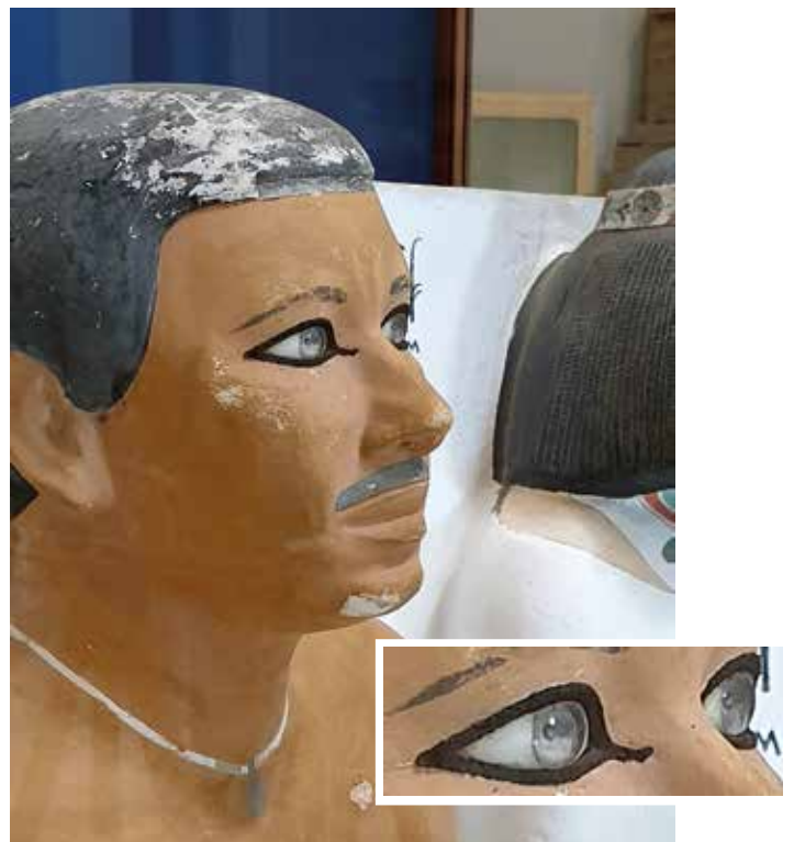
Abb. 12 Die nahezu perfekt gearbeitete kreisrunde Einlage aus Bergkristall mit hintermalter Iris (hinterlegtem Harz?) imitiert ausgesprochen realistisch die menschliche Hornhaut (über einer Linse) mit der dahinter liegenden Pupille und Regenbogenhaut (Iris) an der Figur des Rahotep. Egyptian Museum Cairo (EMC), JE 15207a.

Ebenso interessant wie naheliegend ist, dass es sich bei rückseitig bemalten Einlagen nicht selten um Exemplare handelt, die insbesondere dem Sehen, vielmehr dem Blick des Dargestellten einen lebensnahen Ausdruck verleihen sollen: kleine Augeneinlagen an Menschen- oder Tierdarstellungen, wie sie häufig an Särgen, Mumienmasken, Statuen und Statuetten, weitaus seltener auch an Reliefs vorzufinden sind 47 . Zu unterscheiden sind Hintermalungen, die lediglich ein Detail betonen, z.B. die Pupille eines Auges, oder aber in einer aufwendigeren Ausführung sowohl Pupille als auch Iris oder das vollständige Auge wiedergeben. Die hochwertigsten Ein-