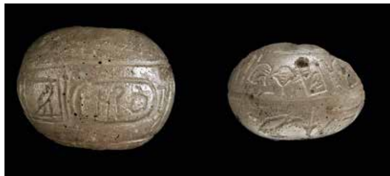
Abb. 6 Für beide Perlen wurde zunächst eine Fertigung aus Bergkristall angenommen, im Rahmen einer erneuten Untersuchung dann transparentes, nahezu farbloses Glas identifiziert. Lufteinschlüsse und eine in Teilen inhomogene Schmelze bewirken eine leichte Trübung. Deir el-Bahri. British Museum, London, EA 26289; 1,2 cm × 1,85 cm (H. × B.) und EA 26290; 2,12 cm (Durchmesser). – (Foto © The Trustees of the British Museum).

Anders als opakes Glas, lässt die transluzente Variante in unterschiedlichem Grad Licht durchscheinen. Transparenz hingegen bezeichnet nicht nur die Licht-, sondern auch Blickdurchlässigkeit bzw. Durchsichtigkeit, weshalb durch transparentes Glas auch nicht nur das Licht, sondern ebenso Dahinterliegendes relativ klar erkennbar ist. In der Beschreibung von Transparenz und Opazität antiker Gläser und anderer Materialien finden häufig noch Begriffe wie semi-opak und semi-transluzent Verwendung, durch die wohl zusätzlich ein eher geringes Maß der Lichtdurchlässigkeit hervorgehoben werden