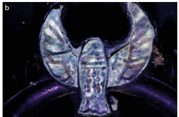
Abb. 16 a Detailaufnahme der rückseitig bemalten Quarzeinlagen an einem rechten Ohrhring aus dem Grabschatz. Ein kleiner Falke mit geöffneten Schwingen, dreiteilig in Zelleinlagen-Technik gearbeitet, befindet sich über dem kleinen, von Uräen flankierten Karneol-Figürchen des Königs. – b In einer Aufnahme unter UV-Beleuchtung werden die streifig ausgeführte Bemalung des Gefieders sowie das kleine Auge der Einlagen (an der Vorderseite des Ohrschmucks) besser sichtbar. Am Bruch der im Bild linken Einlage sind keine schollenartigen Abplatzungen zu erkennen, da es sich vermutlich um eine kalte Bemalung handelt, die Farbe somit wahrscheinlich nur noch in Form einer eher pulvrigen Pigmentschicht vorliegt. – (Fotos Ch. Eckmann, RGZM).