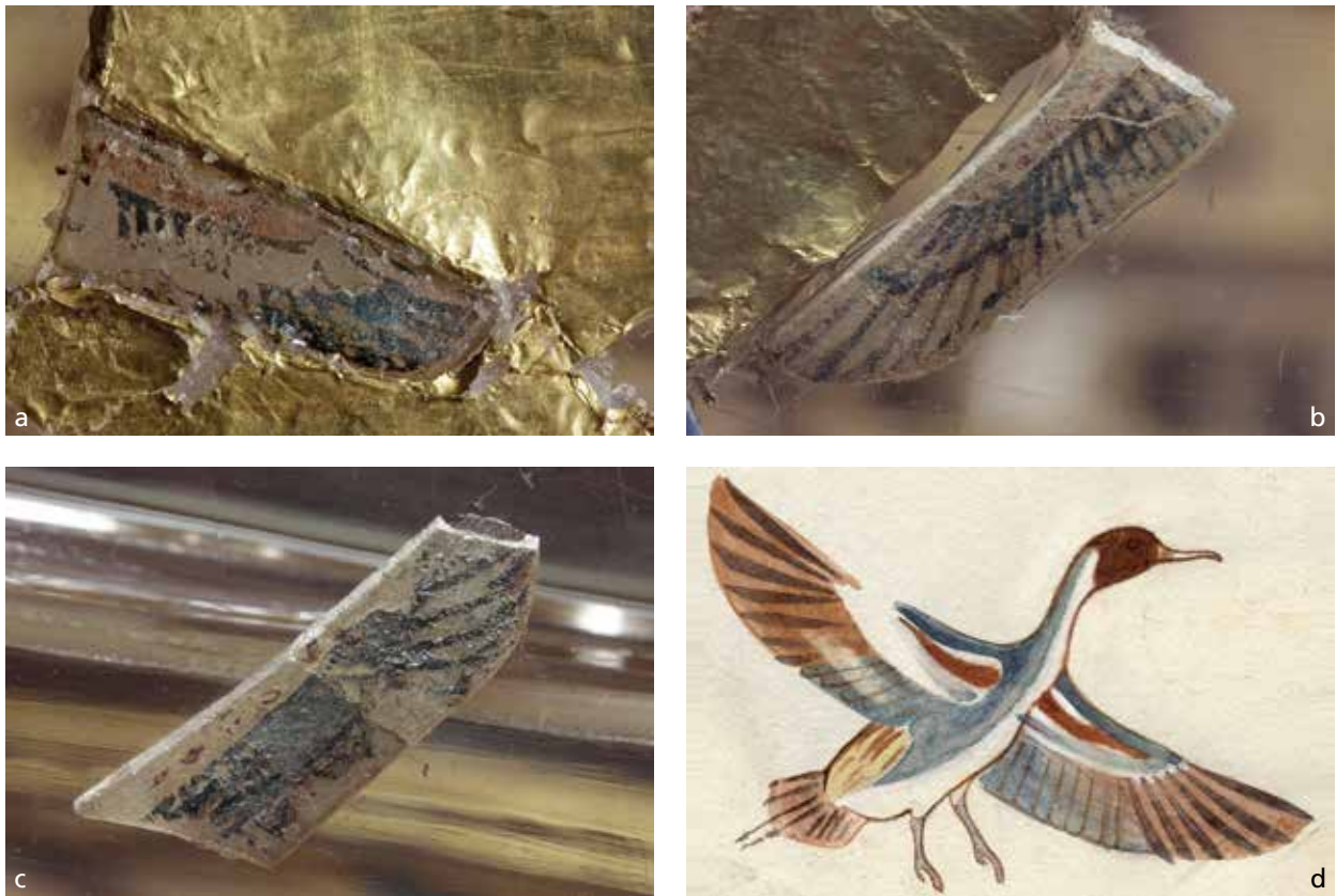
Abb. 23 Detailaufnahmen der erhaltenen Einlagen an den p3 -Zeichen der Sargwanne (wie sie heute montiert sind). Auch sie schmücken – ebenso wie am Deckel – die Schwingen der »fliegenden Ente«, und die Farben Schwarz, Blau und Rot sind erhalten, wobei das blaue Pigment (Ägyptisch Blau) in einer sehr pastösen Form aufgetragen wurde. Nicht zu übersehen ist, dass das Blau über den schwarzen Konturzeichnungen liegt und diese überdeckt ( a-c ), was u. a. dafür spricht, dass es sich dabei eigentlich um eine Hintermalung handelt. Auf der blauen Farbe scheinen hingegen noch Anhaftungen der einstigen Einbettmasse erhalten. Eine weitere Aquarellskizze Carters ( d ) bietet einen schönen Vergleich zur farblichen Gestaltung der Schwingen; an den Einlagen des Sarges sind zusätzlich auch die Federspitzen rot akzentuiert. Egyptian Museum Cairo (EMC), JE 39627(a).1. – (Fotos Ch. Eckmann, RGZM / E. Mertah, EMC; Aquarell H. Carter (Carter_vii_1_07_2m), © Griffith Institute, University of Oxford).