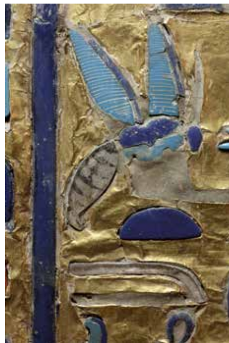
Abb. 24 Das bjt -Zeichen mit Einlagen aus hell- und dunkelblauem Glas. Einzig der Hinterleib wird durch eine hintermalte Einlage im Halbr relief dargestellt. Es ist anzunehmen, dass einst zumindest eine weitere Farbe vermalte wurde.