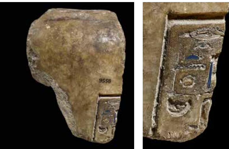
Abb. 7 Die – vermutlich abgeänderte – Inschrift an einer Kanopenvase bezieht sich auf eine »Gemahlin des Königs«, die diesen Status sowohl vor der Amarnazeit als auch unter Echnatons Regierungszeit innehatte. Neben den nur 1-2mm breiten Einlagen aus blauem Glas sind die Hieroglyphen auch mit transparent-farblosem, aber mit roter Farbe hinterlegtem Glas dekoriert. British Museum, London, EA 9558.

Aufgrund dessen erstaunt es nicht, dass auch an der Wanne eines Sarges (KV 55 28 ), der möglicherweise einst für die Bestattung Echnatons geschaffen wurde, transparente, farblose – wenn auch mit kleinen Bläschen durchsetzte – Glaseinlagen zur Dekoration einzelner Hieroglyphen der Inschrift eingesetzt wurden 29 . Ebenso sind einige der zahlreichen Glasstäbchen, die in Tell el-Amarna gefunden wurden, aus transparent-farblosem Glas hergestellt 30 .