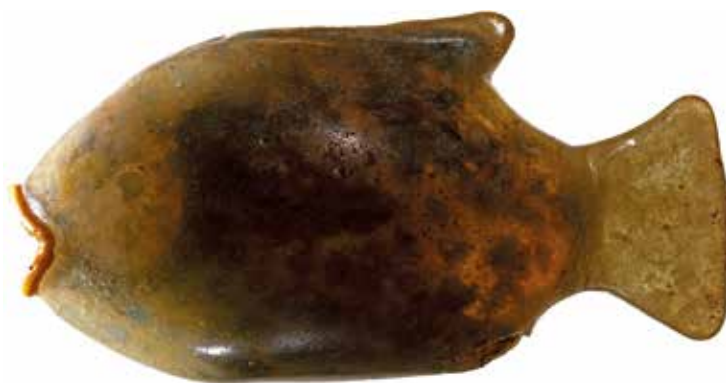
Abb. 10 Gefäß in Form eines Oreochromis niloticus aus der Familie der Buntbarsche. Das transparente Glas weist einen leicht gelblichen Farbton auf, die Mundöffnung ist, ergänzend zur »Bemalung« der Augen, Flossen und Schuppen im Inneren, mit einer gelben Fadenaufgabe akzentuiert. Brooklyn Museum, New York, Abbott Collection, Charles Edwin Wilbour Fund, 37.316E; 10,7 cm (L.).

demonstrierend – mit einer detailreichen figürlichen Darstellung, möglicherweise einer Triumphszene, dekoriert 41 .