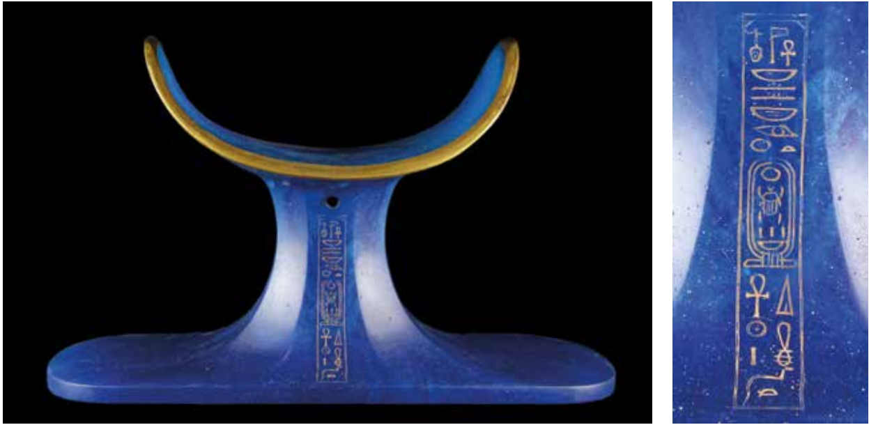
Abb. 2 Die Ausarbeitung der Hieroglyphen ist außerordentlich sorgfältig und in handwerklich hoher Präzision gelungen. Etwaige Vorzeichnungen sind nicht oder nicht mehr erkennbar. Auch bei dieser Inschrift scheint es, als ob man zur Hervorhebung die »Gravuren« mit einer farbigen Substanz aufgefüllt hätte. Maße ca. 28,3 cm x 17,5 cm x 10 cm (B. x H. x T.), jetzt im Grand Egyptian Museum, Giza.

lotosförmiger Becher aus der Sammlung des Metropolitan Museum of Art in New York 7 oder eine kleine Persea -Frucht aus dem Grab Tutanchamuns, beide aus einem türkisblauen Glas und mit einer Namenskartusche des Thutmosis III. dekoriert 8 . Zur besseren Sichtbarkeit wurden die Gravuren häufig auch farblich akzentuiert 9 .