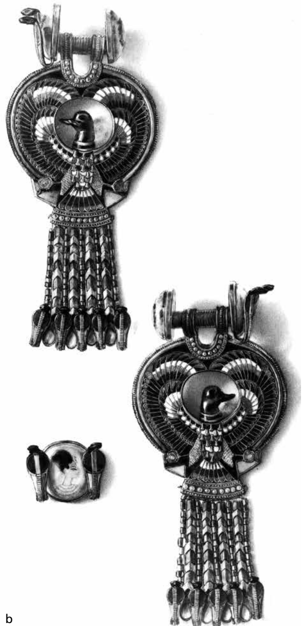
Abb. 27 a Das Exemplar des auf der linken Seite zu tragenden Ohrings: Die Darstellung eines Falken mit einem Enten- oder Gänsekopf und nach oben geöffneten Schwingen bildet das dominierende Ornament des Ohrings, der mit zahlreichen Einlagen aus farbigem Glas und Stein verziert ist. Zwei kreisrunde Endstücke – jeweils eine Trägerscheibe aus Gold mit einer rückseitig bemalten Einlage aus Glas – bilden den Abschluss zweier Tuben, die das Gehänge am Ohr des Trägers fixieren. Egyptian Museum Cairo (EMC), JE 61969. Demnächst im Grand Egyptian Museum, Giza. – b Durch eine geradezu als fotorealistisch zu bezeichnende Illustration des Ohringpaares ist das Miniaturporträt bereits seit nunmehr fast 100 Jahren gut dokumentiert. Sicherlich ist das eine der Ursachen dafür, dass es auch so gut wie die einzige weithin bekannte Hintermalung der gesamten Grabsausstattung darstellt. – (a Foto Ch. Eckmann, RGZM; b Foto H. Burton [p780], © Griffith Institute, University of Oxford).

Das zentrale Motiv des Ohrschmucks bildet die Darstellung eines Falken mit einem zur Seite gewandten Enten- oder Gänsekopf 88 und nach oben geöffneten Schwingen. Am Schwanzgefieder hängen kleine